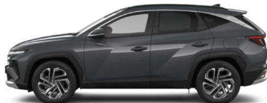
Ecotronic Grey Pearl Kontrastdach verfügbar