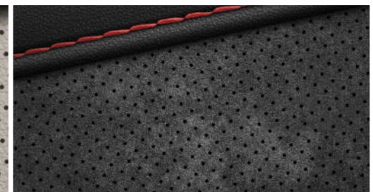
Leder-/Alcantara Kombination 9) N Line