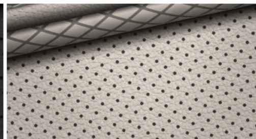
Lederinnenausstattung 8) hellgrau